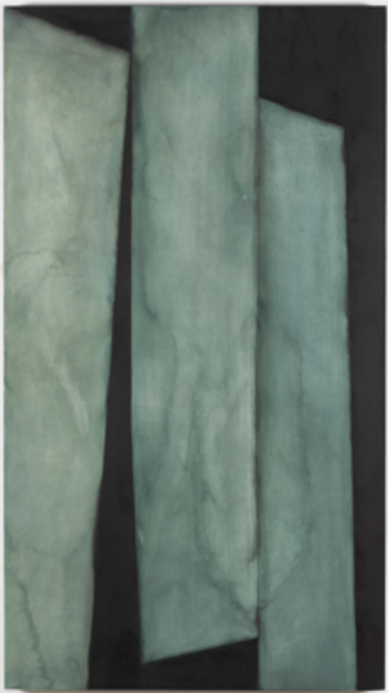
© Oeuvre de Pierre Vande Pitte

Pierre Vande Pitte a ouvert pour la première fois les portes de son atelier à l'occasion du Parcours d'Artistes de Saint-Gilles. Son espace est vivant, parcouru par une lumière diffuse et par les éléments. Un impressionnant lierre grim pant recouvre la toiture de verre. Une plateforme de bois et quelques portes délimitent l'espace blanc. De grandes peintures tentent de tutoyer le ciel.