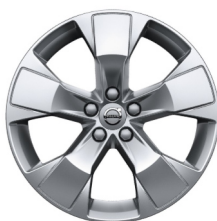
18" 5-Spaaks Silver 921