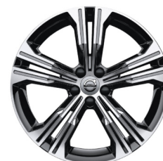
19" 5-Dubbel Spaaks Black / Diamond Cut 924