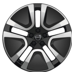
19" 5-Dubbel Aero Spaaks Glossy Black / Diamond Cut 1077