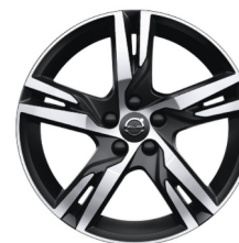
18" 5-Dubbel Spaaks R-Design Matt Black / Diamond Cut