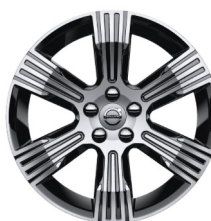
18" 6-Spaaks Inscription Black / Diamond Cut