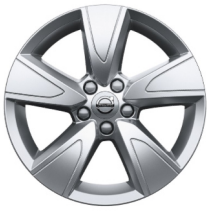
17" 5-Spaaks Silver