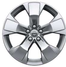
18" 5-Spaaks Silver 921