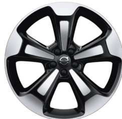
20" 5-Spaaks Black / Diamond Cut 917