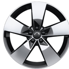
19" 5-Spaaks Black / Diamond Cut 922