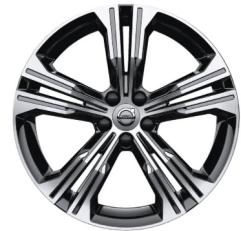
19" 5-Dubbel Spaaks Black / Diamond Cut 924