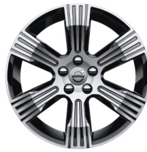
18" 6-Spaaks Inscription Black / Diamond Cut