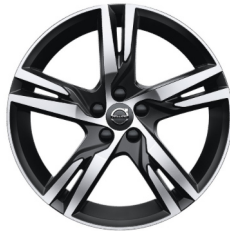
19" 5-Dubbel Spaaks Matt Black / Diamond Cut 911