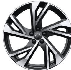
20" 5-Dubbel Spaaks Matt Black / Diamond Cut 920