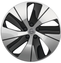
18" 5-Aero Spaaks Glossy Black / Diamond Cut 1076