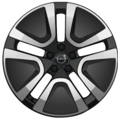
19" 5-Dubbel Aero Spaaks Glossy Black / Diamond Cut 1077