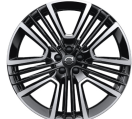
21" 5-Dubbel Spaaks Black / Diamond Cut 800141