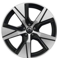
19" 5-Spaaks Black / Diamond Cut