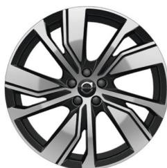
20" 5-Dubbel Spaaks Black / Diamond Cut 1133